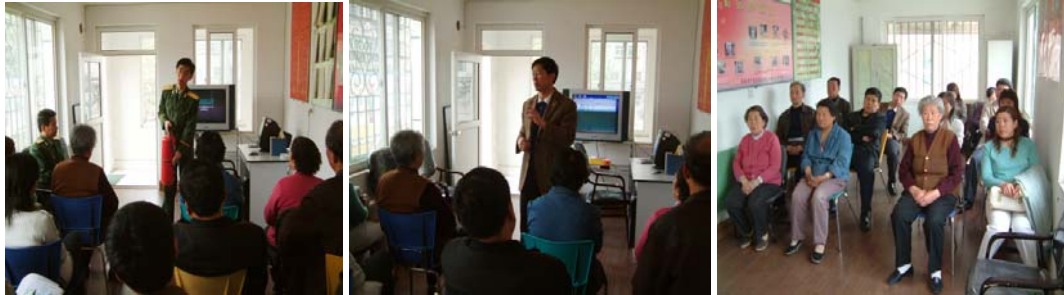
ให้คำแนะนำเกี่ยวกับอัคคีภัย

หลังจากได้รับชุมชนปลอดภัย ชุมชนยูธ ปาร์ค ได้จัดลำดับความสำคัญเรื่องอัคคีภัย เป็นอันดับแรก ซึ่งถือว่าเป็นประโยชน์อย่างยิ่งแก่คนในชุมชน