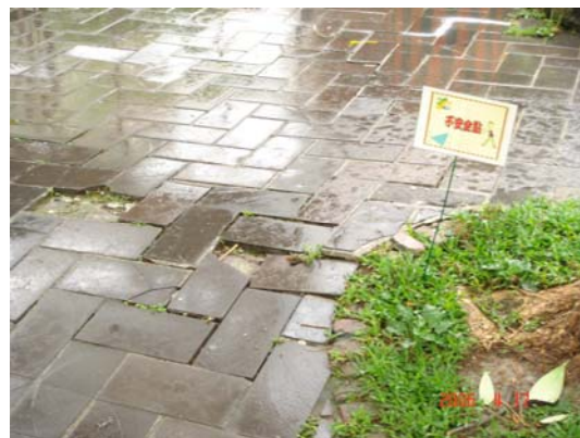
บาทวิถีที่ชำรุด