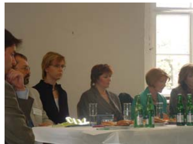
The Press Conference

จากการสัมมนา พบว่า การร่วมมือกันดำเนินการของหลายฝ่ายตามวิธีการของ WHO injury prevention community based programmes เป็นหนทางที่ถูกต้องในการแก้ปัญหา อุบัติเหตุบนท้องถนนของเด็ก ในสาธารณรัฐเชค