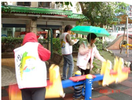
สำรวจเครื่องโยก