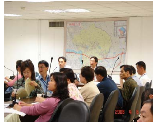
อบรมก่อนดำเนินการสำรวจ

เครื่องเล่นสนามประเภทแกว่ง ได้รับการสำรวจมากเป็นพิเศษพบว่าไม่มีเครื่องเล่นใดที่อยู่ในระดับปลอดภัย ระยะแกว่งไม่เพียงพอ การติดตั้งไม่มั่นคง ที่นั่งแกว่งไม่มีมาตรฐาน นอกจากนั้น ยังมี เครื่องเล่นประเภทลื่นที่ชำรุด (25%), เครื่องโยก (18.5%) มีป้ายเตือนเพียงป้ายเดียว ไม่ม อุปกรณ์ช่วยชีวิต ใดๆ