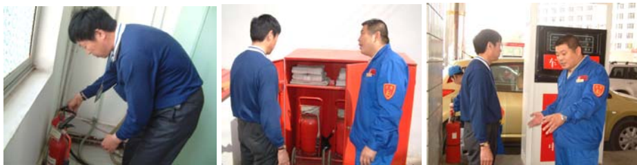
ตรวจสอบความปลอดภัย ในสถานีน้ำมัน

เมื่อวันที่ 20 เมษายนที่ผ่านมา มีการจัดแสดงวิทัศน์ เกี่ยวกับความรู้เรื่องอัคคีภัย โดยแสดงให้เห็นถึงเหตุการณ์สำคัญต่างๆ ความเสียหายที่ได้รับ และวิเคราะห์หาสาเหตุ รวมทั้งมีการออกสำรวจความปลอดภัยตามสถานที่ต่างๆ เช่นที่สถานีน้ำมัน โดยสำรวจวิธีการควบคุมเพลิง การดับไฟและอุปกรณ์ ดับไฟ การฝึกอบรม และตารางการตรวจสอบความปลอดภัย